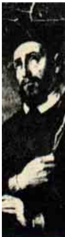
Due immagini storiche di don Nicolò Rusca, arciprete di Sondrio

Ordinato sacerdote il 23 maggio del 1587 dal vescovo della diocesi di Como Gianantonio Volpi, Nicolò Rusca fu nominato, dopo un breve periodo di ministero pastorale nel borgo di Ses-